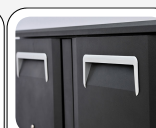
Poignée de porte en mousse