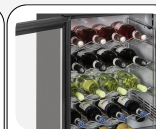
Étagères à vin disponibles en option