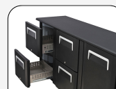
Ensemble de 2 tiroirs en kit distinct