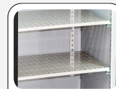
Étagères réglables en acier inoxydable anti-basculement